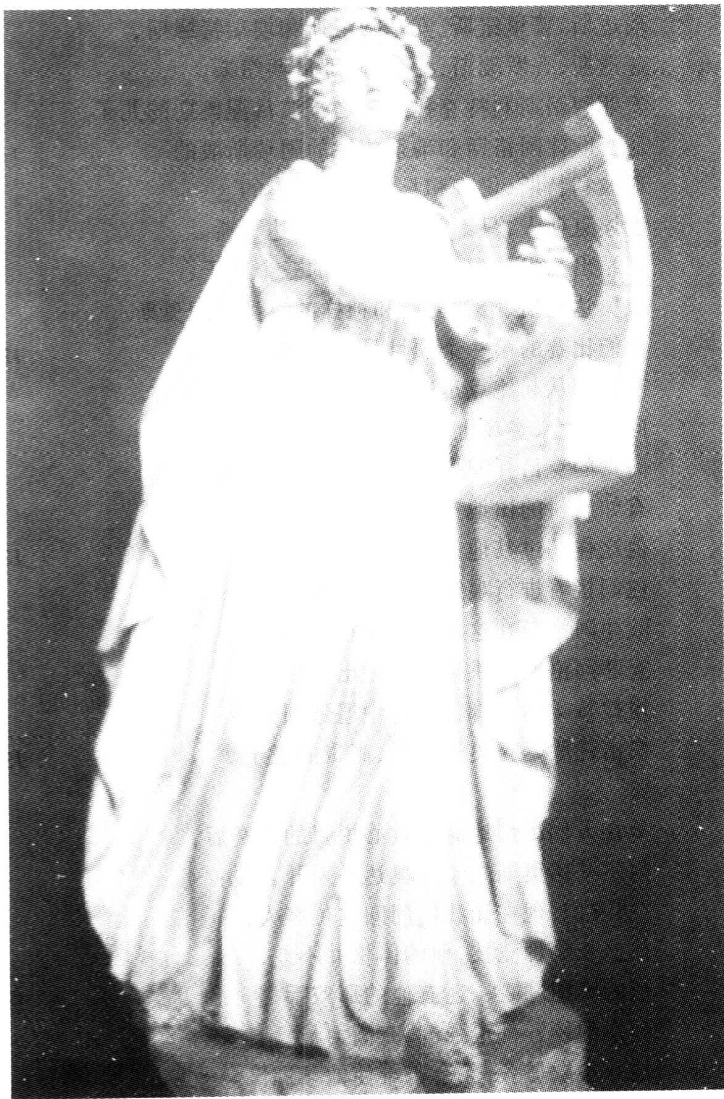
文艺女神 古代雕像