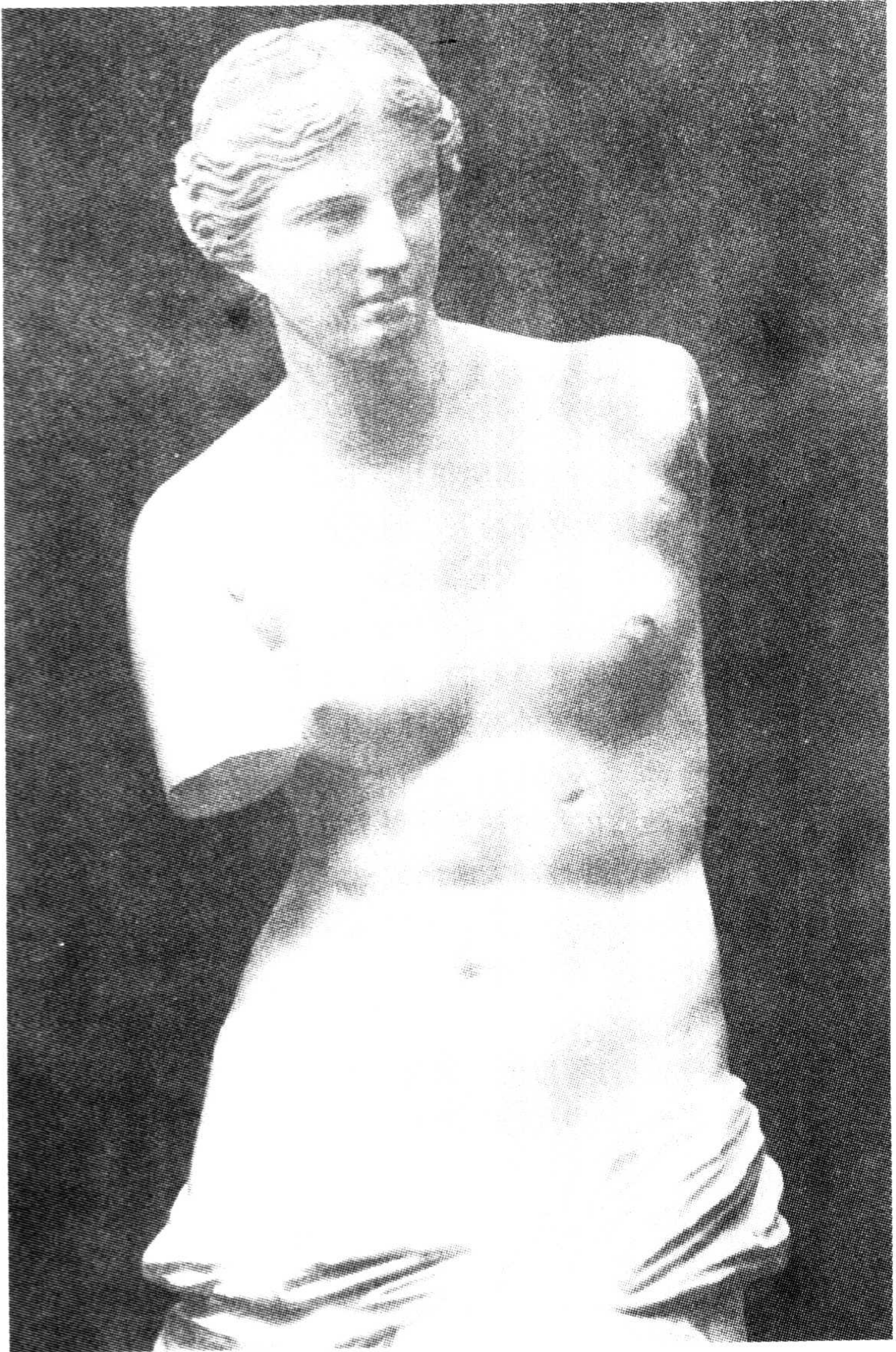
阿佛罗狄忒 古代雕像