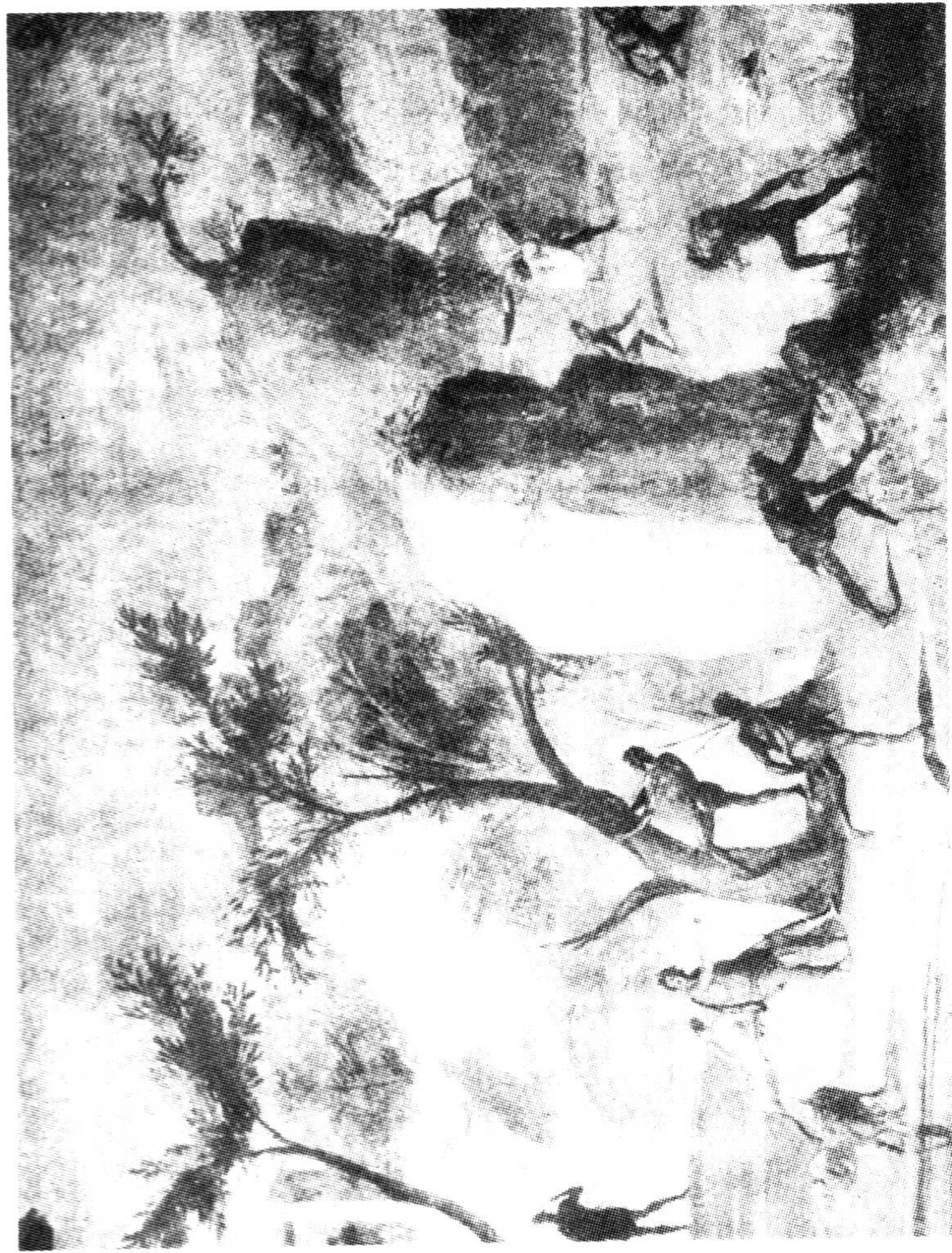
莱斯特律戈涅斯人 古罗马时代壁画