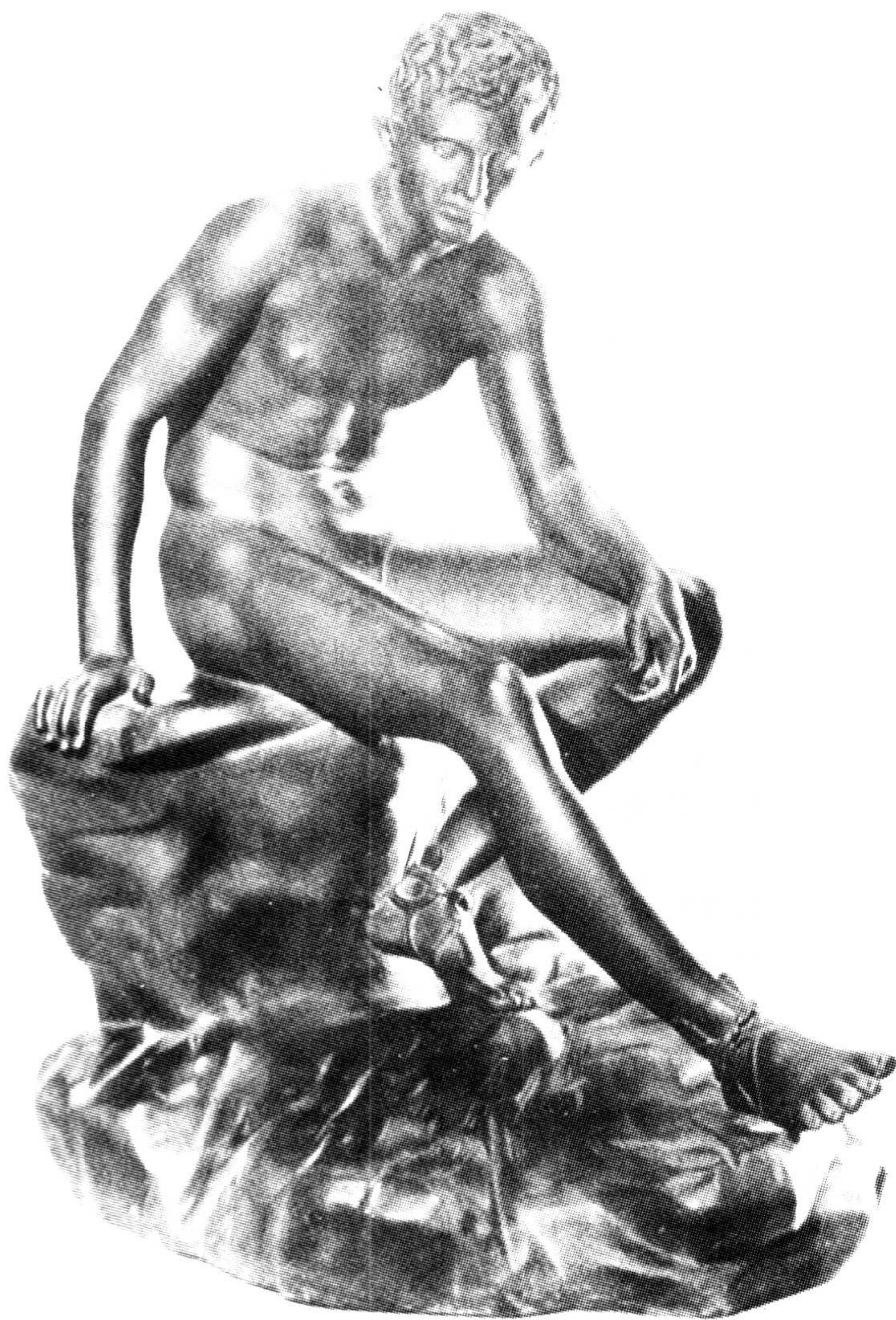
赫尔墨斯 古代雕像