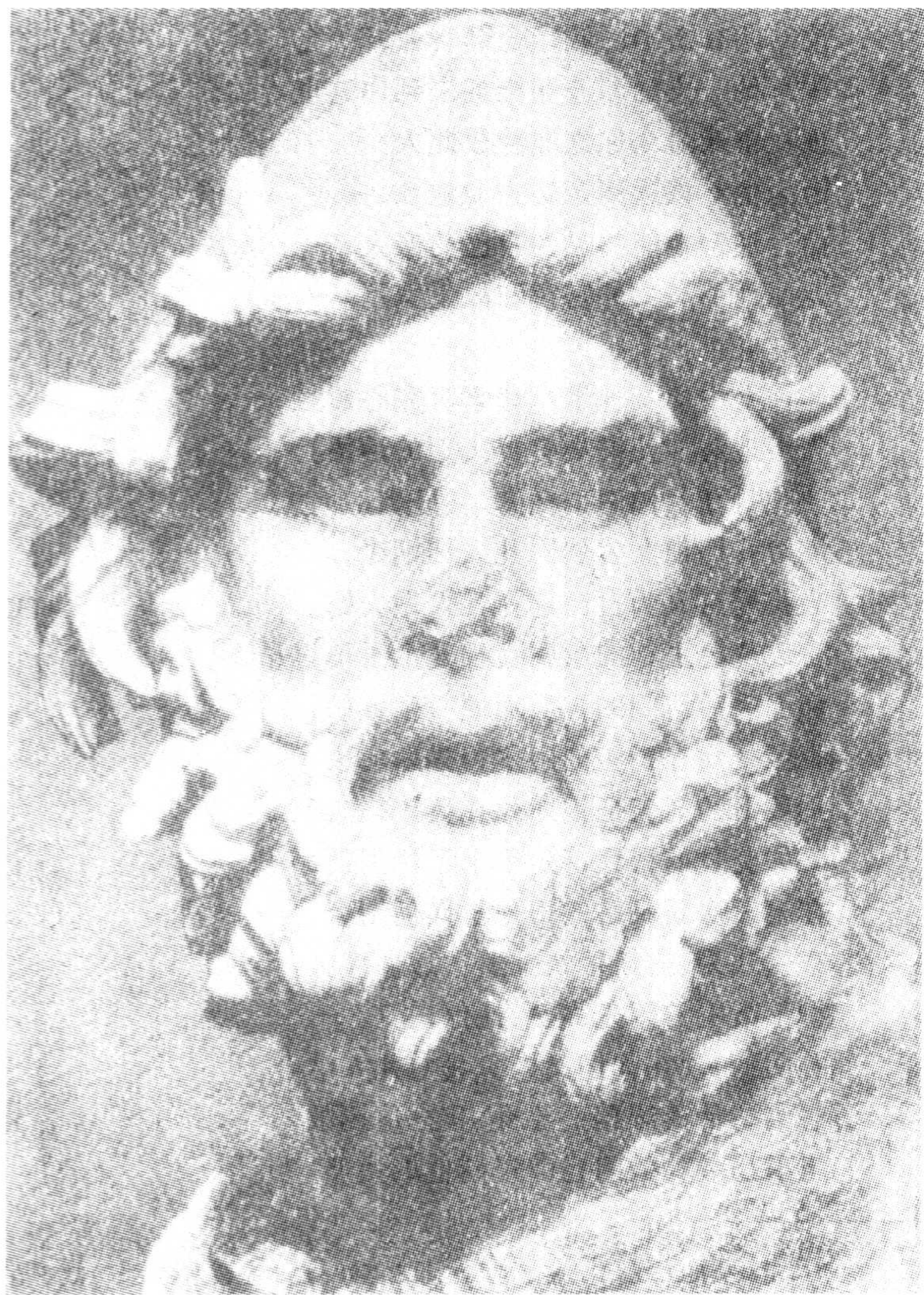
奥德修斯 古代雕像